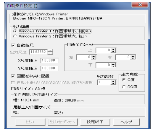
印刷条件設定画面